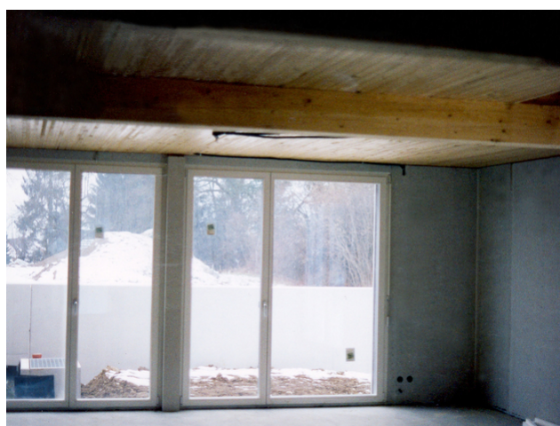
Un coup d'œil dans le salon en cours de construction