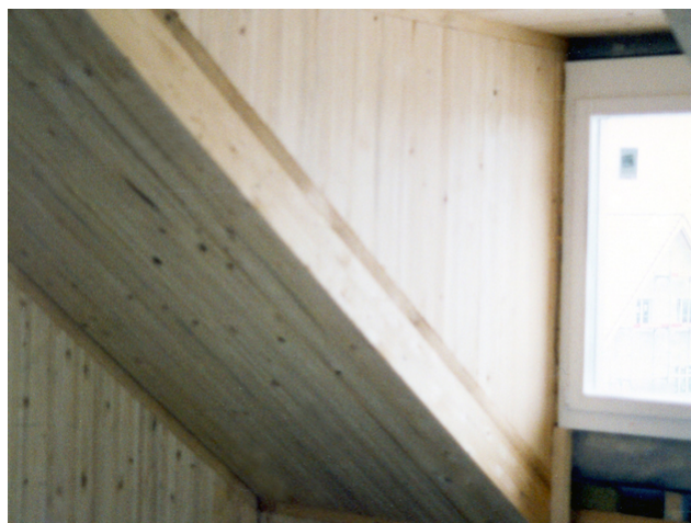
Lucarne de l'intérieur