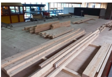
Plate-forme de travail Flück Holzbau AG, Wangen

La Simmental Arena, la nouvelle salle multifonctionnelle de Zweisimmen, est composée en grande partie de bois suisse. De plus, elle n'a pas besoin de piliers à l'intérieur. Le toit est soutenu par dix fermes en arc de 38 mètres de long., Zweisimmen