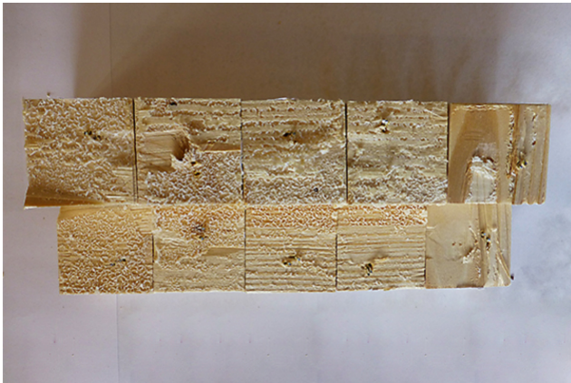
Surfaces cassées avant la coloration