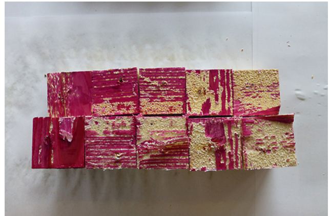
Surface brisée après la coloration