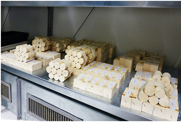
Eprouvettes pour l'essai de cisaillement