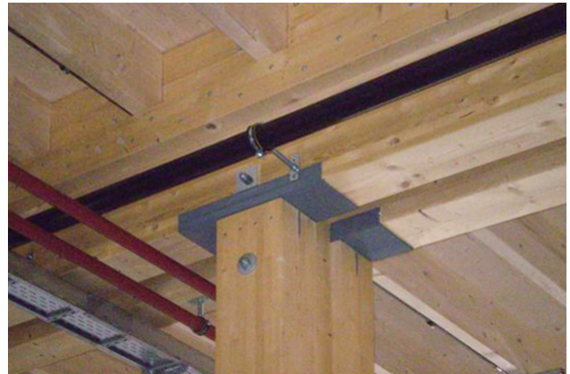
Renfort de compression transversale avec profilé en U en acier, structure porteuse secondaire sur lattes porteuses