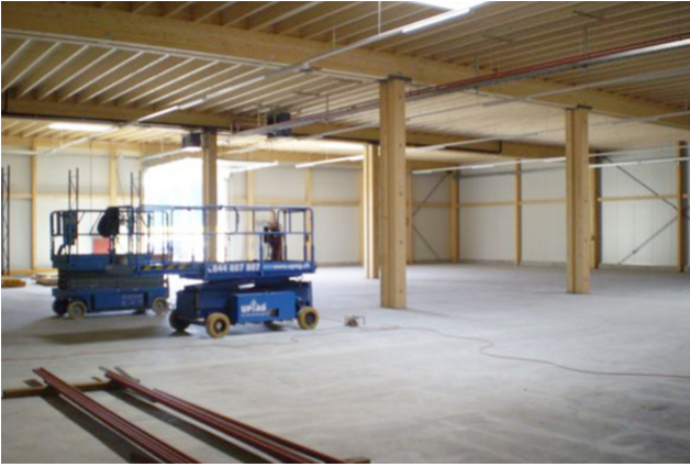
Vue intérieure du gros œuvre