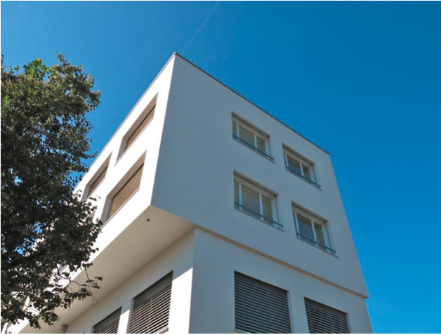
Le surplomb marqué souligne la frontière entre l'ancien et le nouveau