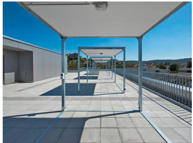
Grande terrasse sur le toit avec vue sur Lenzbourg