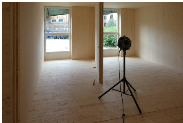
Schallmessung im Mockup