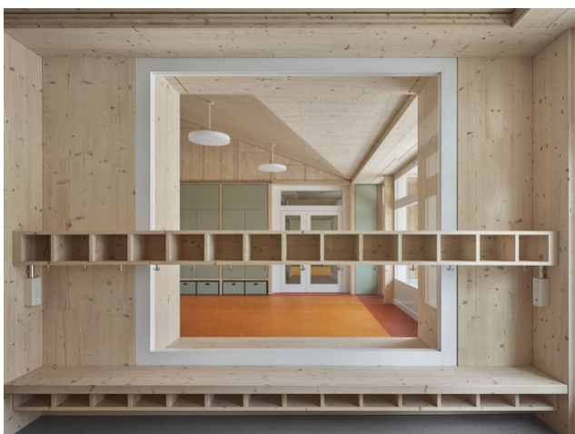
Le bois, élément phare de l'architecture d'intérieur