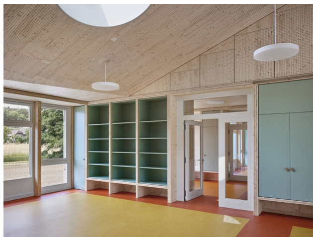
Concepts de couleurs et de matérialisation cohérents à l'intérieur