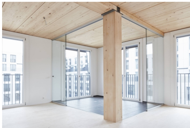
Loggia avec piliers et plafonds en bois