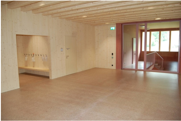
Cage d'escalier avec vestiaire