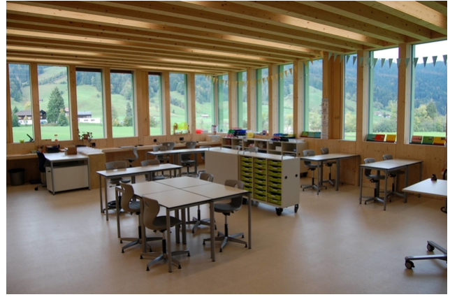
Salle de classe