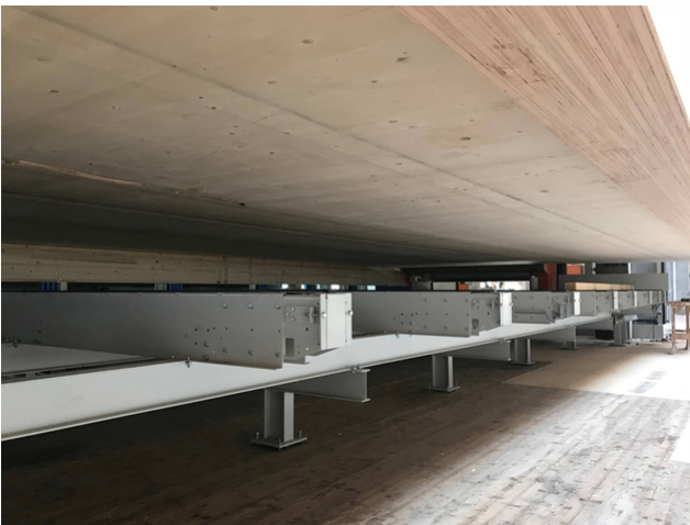
Blick auf die Konstruktion der Plattform von unten