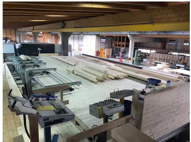
Die neue Arbeitsplattform bietet den Holzbauern sehr viel Platz