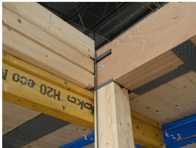
Träger aus Buchenholz