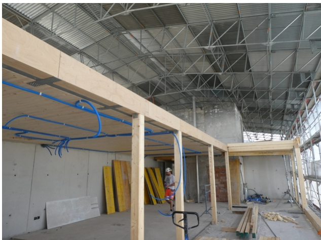
Aufstockung unter dem Notdach