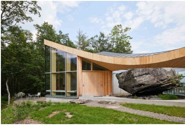
Der Stein ist das Zentrum des Gebäudes