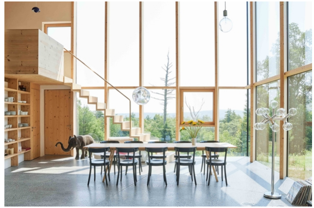
Innenansicht des Gebäudes