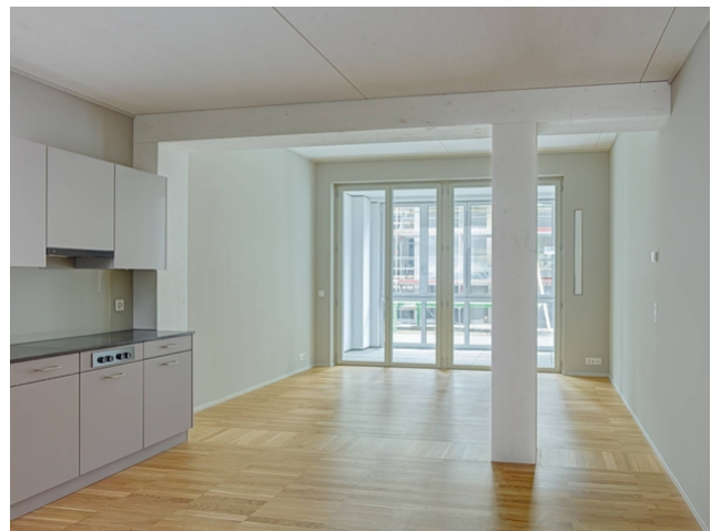
Innenansicht der fertigen Wohnung