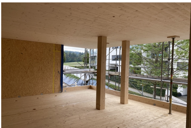
TS3-Konstruktion in der Bauphase