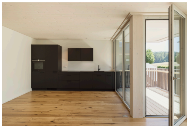
TS3-Konstruktion im fertigen Zustand