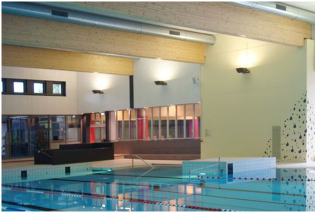
Innenansicht gegen Lernpool