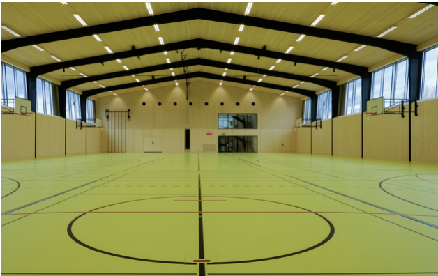
Innenansicht nach der Sanierung