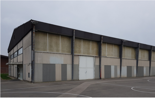
Turnhalle vor der Sanierung