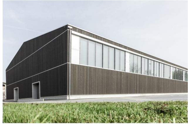
Turnhalle nach der Sanierung