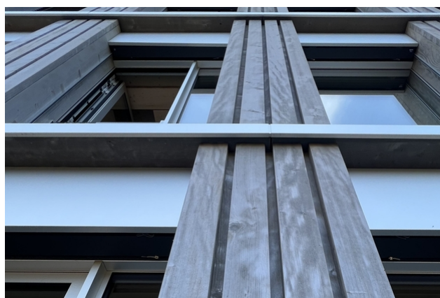
Holzfassade mit Oberflächenbehandlung.