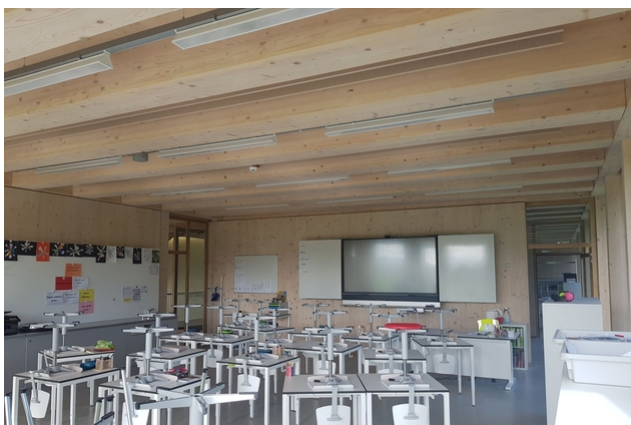
Innenansicht eines Klassenzimmers.