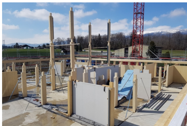
Impression beim Aufrichten Erdgeschoss.